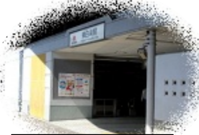
東白楽駅から徒歩8分