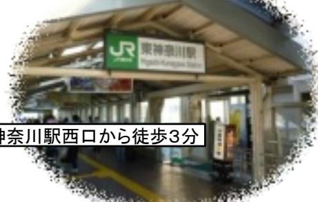
東神奈川駅西口から徒歩3分